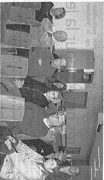
Pour les licenciés, pas question de financer les réparations avec la municipalité.